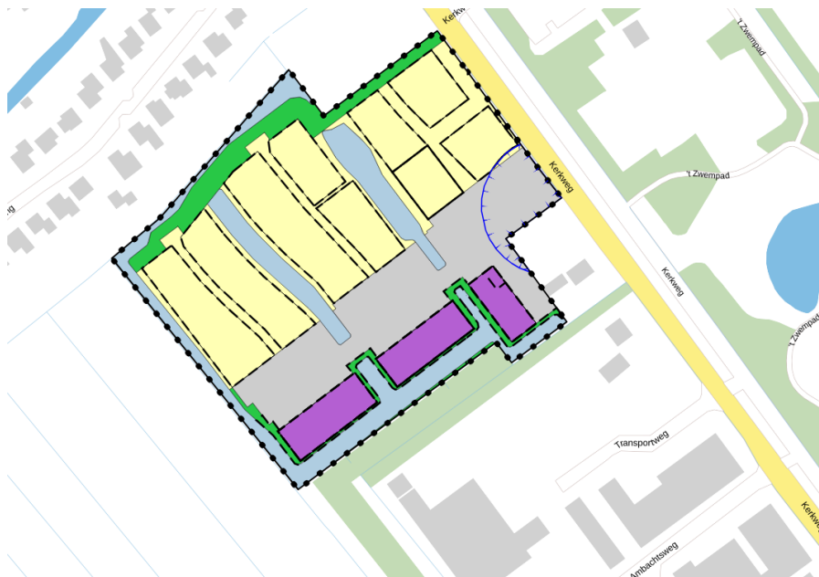
Afbeelding 2. Bestemmingsplan 'Achter de Wetering'. Uitsnede Ruimtelijkeplannen.nl

Het plangebied ligt aan de Kerkweg tussen het dorp Giessenburg en het bedrijventerrein. Het plangebied is kadastraal bekend als Giessenburg, Sectie G, nummers: 2506, 2509, 2670 en 2671 (gedeeltelijk). Het plangebied wordt aan de noord-, oostzijde en zuidzijde begrensd door een brede watergang, de Kerkweg en het tankstation. Aan de zuidwestzijde grenst het plangebied aan het open landschap.