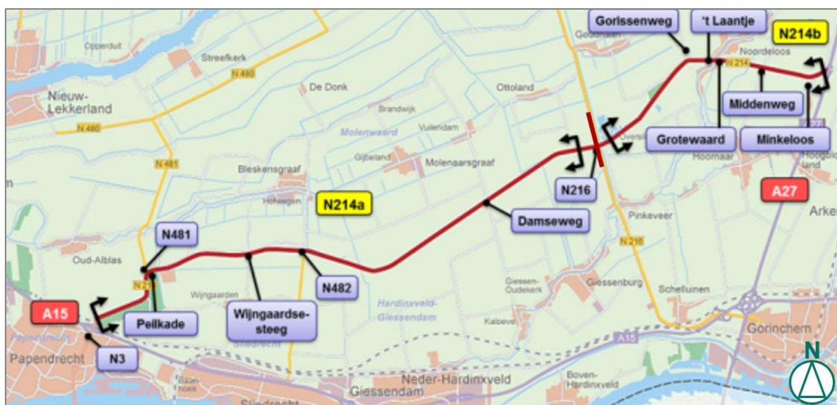
Afbeelding 1 N214 A en B

In 2020 hebben Gedeputeerde Staten het Definitief Ontwerp voor het project vastgesteld. Hierover zijn Provinciale Staten per brief van 12 mei 2020 geïnformeerd (PZH-2019-714667533). Met de vaststelling van het ontwerp kon de planologische procedure worden gestart en de kon de grondverwerving worden aangevangen. De planologische procedure is inmiddels door de gemeente Molenlanden afgerond en de grondverwerving verloopt voorspoedig.