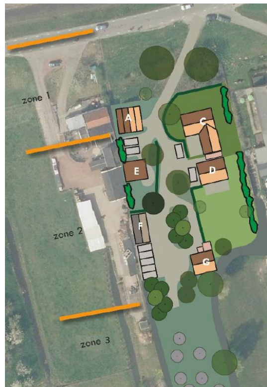
Afbeelding 2: Nieuwe situatie