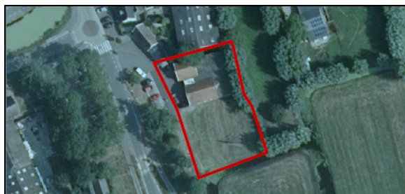
Luchtfoto met aanduiding plangebied

Aan de Damseweg 113 in Ottoland is op dit moment een brood- en kaaswinkel gevestigd (zie onderstaande afbeelding) en aan de Damseweg 97 een fietswinkel. Naast de kaaswinkel ligt een woonbestemming met een bouwvlak. Op initiatief van de fietsmaker zijn zij in gesprek gegaan om een plan te maken voor de nieuwbouw van een multifunctioneel pand aan Damseweg 113. In dit nieuwe pand is er ruimte voor de fietswinkel om verder te kunnen groeien en is ook een werkplaats. Ook de kaaswinkel wordt in het nieuwe pand gevestigd, waarbij er ruimte overblijft om uit te breiden met andere producten zoals groenten en fruit. Hierover zijn al gesprekken met lokale ondernemers. Boven de winkelruimte worden zes appartementen gerealiseerd, waarvan vijf in de huursector. Aan de voorkant van het pand komen parkeerplaatsen en groen en er is voldoende ruimte om marktkramen te plaatsen.