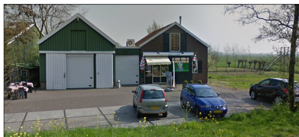
Huidige bebouwing Damseweg 113

Dit bestemmingsplan draagt bij aan het behoud en de groei van de lokale ondernemers van Ottoland en creëert een nieuw woningaanbod waar in Ottoland vraag naar is. De ruimtelijke kwaliteit van het perceel verbetert sterk. Het bestaande pand heeft een verouderde uitstraling. Het nieuwe pand wordt wat hoger dan de bestaande bebouwing, maar met een maximale goothoogte van 8,5 meter. Het pand krijgt een modern-landelijke uitstraling die past bij Ottoland en waarbij aandacht is voor detaillering. De ruimte rondom biedt voldoende parkeergelegenheid en wordt zo groen mogelijk ingericht. De exacte invulling hiervan is aan de orde bij het verlenen van de Omgevingsvergunning.